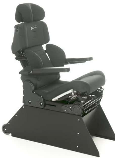
Tilt sittepute. 25 grader