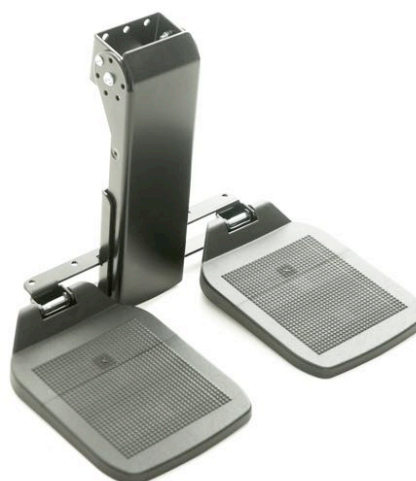
Fotbrett. (Legg lengde 32 til 46 cm) Art. Nr. 1423