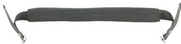
Hoftesele med polstring Art. Nr. 1417 Medium Art. Nr. 1418 Large