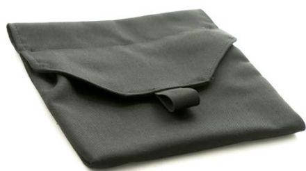
Armleneveske Art.nr: 1422