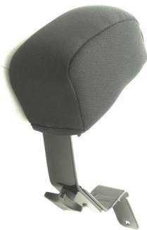
Abduksjonskloss / bendeler Art.nr: 1432