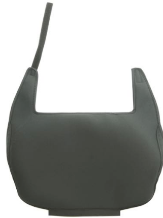
Inkontinenstrekk rygg (nedre del) Setebredde 52 cm Art. Nr. 1430 Inkontinenstrekk rygg (nedre del) Setebredde 57 cm Art. Nr. 1431