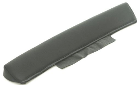
Trekantpute til, mellom sete og rygg Til setebredde 52 og 57 cm Art.nr: 1433