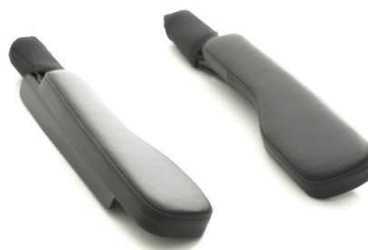
Armlener H. Side Art. Nr. 1420 Armlener V. Side Art. Nr. 1421