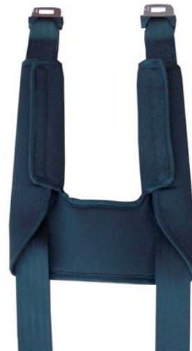
Brystsammenføyning til 5 punkt sele Art. Nr. 1337