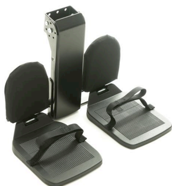
Leggputer Art.nr: 1425 Fotbrettreimer Art.nr: 1426