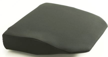
Pute som gjør setet flatt når ryggen legges helt bakover. Ca sittedybde må oppgis og setebredde 52 eller 57 cm Art.nr: 1434