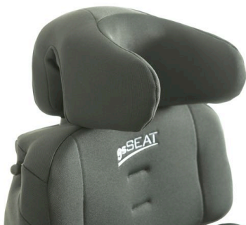
Nakkepute med store støtter Art nr: 1407 (Dette art. Nr. Erstatter std. Nakkeputen) Art nr: 1408 (Brukes ved best. Av nakkepute som del)