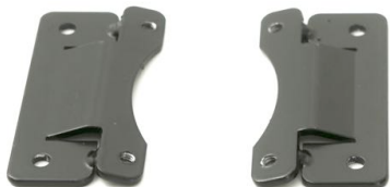
Vinkelbraketter til sidevanger rygg (par) Anbefales til tynne eller små brukere (Kan kun benyttes på std 12 cm dybde) Art.nr: 1404