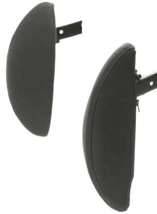
Sidevanger rygg 8 cm dybde (par) Art nr: 1405 ( Dette art. Nr. Erstatter std. Sidv rygg) Art nr: 1406 (ved bestilling av sidevange som del)