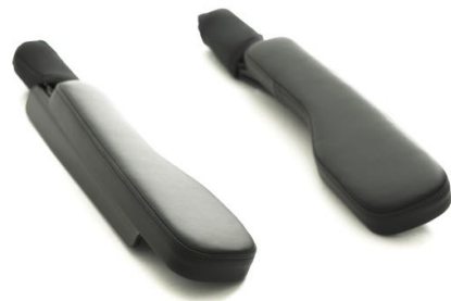
Armlener H. Side Art. Nr. 1420 Armlener V. Side Art. Nr. 1421