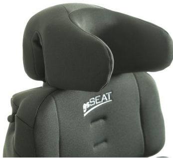
Nakkepute med store støtter Art nr: 1407 ( Dette art. Nr. Erstatter std. Nakkeputen) Art nr: 1408 (Brukes ved best. Av nakkepute som del)