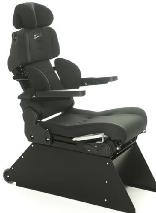
Sittedybde. Fra 37 til 55 cm