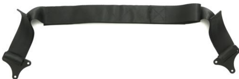
Brystsele, borrelås m. Polstring Art. Nr. 1413 Medium Art. Nr. 1414 Large