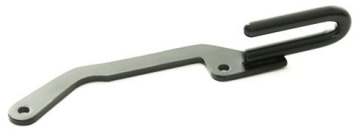
Sikkerhetssele avlaster Til 3 punkt sele, H/V montering 1419