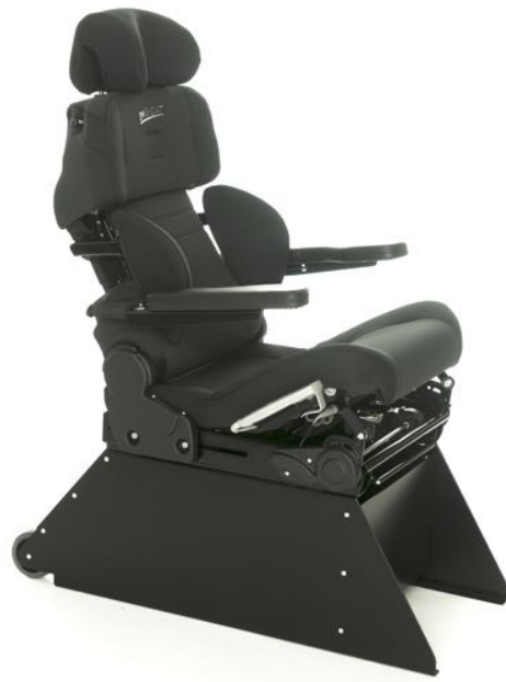
Tilt sittepute. 25 grader