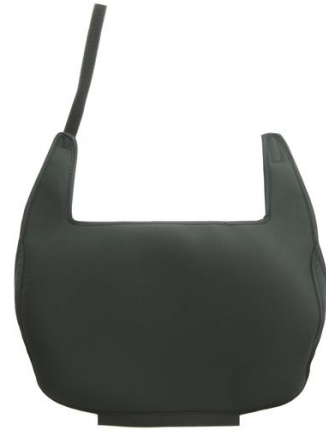
Inkontinenstrekk rygg (nedre del) Setebredde 52 cm Art. Nr. 1430 Inkontinenstrekk rygg (nedre del) Setebredde 57 cm Art. Nr. 1431