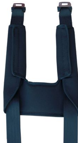
Brystsammenføring til 5 punkt sele Art. Nr. 1337