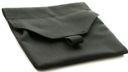
Armleneveske Art.nr: 1422