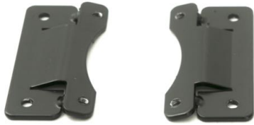
Vinkelbraketter til sidevanger rygg (par) Anbefales til tynne eller små brukere (Kan kun benyttes på std 12 cm dybde) Art.nr: 1404