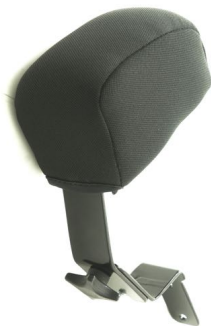
Abduksjonskloss / bendeler Art.nr: 1432