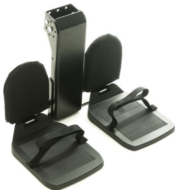
Leggputer Art.nr: 1425 Fotbrettreimer Art.nr: 1426