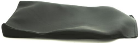
Inkontinenstrekk Sittepute Setebredde 52 cm Art. Nr. 1428 Art. Nr. 1428 Inkontinenstrekk Sittepute Setebredde 57 cm Art. Nr. 1429