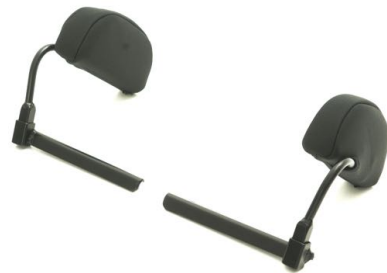
Kne/ Lårstøtter, avtagbare (par) Art.nr: 1409