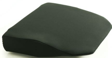
Pute som gjør setet flatt når ryggen legges helt bakover. Ca sittedybde må oppgis og setebredde 52 eller 57 cm Art.nr: 1434