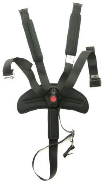
Sele 5 punkt m. Polstring Art. Nr. 1412