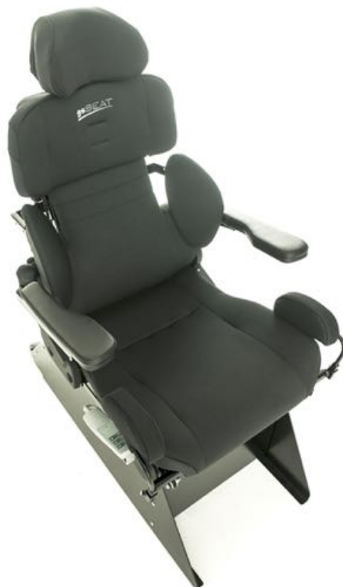
Regulering. Bredde, sidevanger rygg og kne/lårstøtter