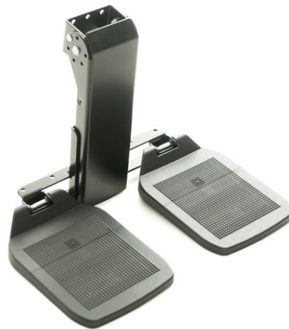
Fotbrett. (Legg lengde 32 til 46 cm) Art. Nr. 1423