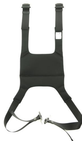
H sele Art. Nr. 1415 Medium Art. Nr. 1416 Large