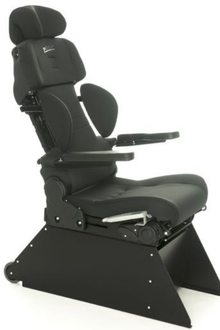
Kyfose (rygg øvre del) 45 grader justering. Rygghøyde justering. 53 til 71 cm