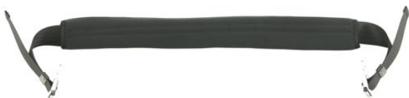
Hoftesele med polstring Art. Nr. 1417 Medium Art. Nr. 1418 Large