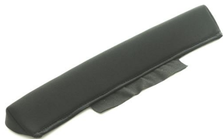
Trekantpute til, mellom sete og rygg Til setebredde 52 og 57 cm Art.nr: 1433